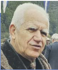
Γράφει ο ΝΙΚΟΛΑΟΣ ΝΙΚΑΣ Ταξίαρχος ε.α. ΣΣΕ 76 Υπεύθυνος βιβλιοθήκης ΕΑΑΣ