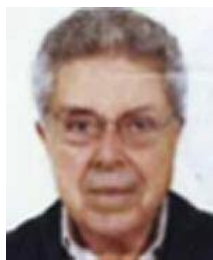
Γράφει ο Αντγος ε.α. Κώστας Ε. Παδουβάς

Μ ε την ευκαιρία της συμπλήρωσης 100 χρόνων από την λήξη του Ελληνοτουρκικού (Ε/Τ) πολέμου 1919-1922, η σημερινή πολιτική και στρατιωτική ηγεσία της Τουρκίας επισκέφτηκε διάφορους χερσαίους χώρους διεξαγωγής των μαχών του πολέμου εκείνου στη Μικρά Ασία (Αφιόν Καραχισάρ κ.ά.), όπου έγιναν σχετικές και οργανωμένες εορταστικές εκδηλώσεις.