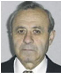
Γράφει ο Υπτος ε.α. Γεώργιος Γκορέζης, αρθρογράφος, συγγραφέας