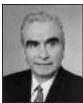
Γράφει ο ΙΩΑΝΝΗΣ ΑΣΛΑΝΙΔΗΣ Αντιστράτηγος ε.α.

Δυστυχώς και πάλιν εντός ολίγου, απ' ότι πληροφορούμεθα, θα έχουμε νέα αντιπαράθεση, μεταξύ Κυβέρνησης και Εκκλησίας.