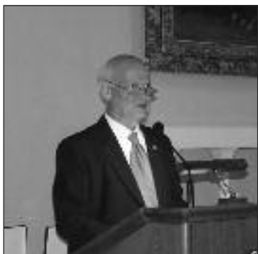
Συνέχεια από τη σελίδα 1