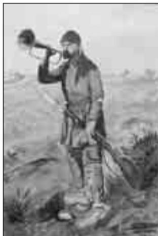
Το τελευταίο σάλπισμα.