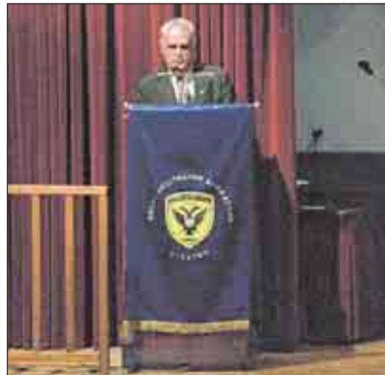
Ο Πρόεδρος της Ένωσης Αποστράτων.

Στη συνέχεια το λόγο έλαβε ο κεντρικός ομιλητής της βραδιάς υποστράτηγος Χ. Μπαλιώσης, ο οποίος έκανε σύντομη αναδρομή στην πολιτικο-στρατιωτική κατάσταση που επικρατούσε στην Ευρώπη του 1939-1940, στις επεκτατικές βλέψεις της Ιταλίας, στην προπαρασκευή της Ελλάδος, στα επιχειρησιακά σχέδια και στο συσχετισμό των αντιπάλων δυνάμεων, στη βύθιση