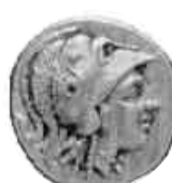
Χρυσός στατήρ Μεγάλου Αλεξάνδρου