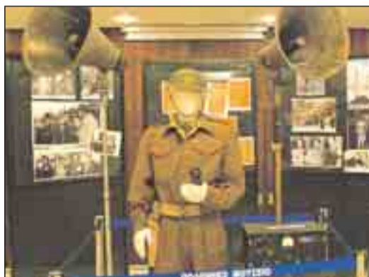
Οι Ενοπλεις Δυνάμεις έπαιξαν πρωταρχικό ρόλο στη δημιουργία, οργάνωση, συγκρότηση και πορεία της Ελληνικής Ραδιοφωνίας.

Εξαιρετική έκθεση διοργάνωσε το δημοσιογραφικό Ίδρυμα Μπότση, με το Πολεμικό Μουσείο για τη συμβολή της Ραδιοφωνίας στη διαδρομή του Έθνους. Η Ελληνική Ραδιοφωνία συμπλήρωσε 80 χρόνια ζωής. Εκτέθηκαν παλιά ραδιόφωνα, ραδιογωνιόμετρα, που στην Κατοχή συνέλαβαν τους κατόχους των παράνομων ραδιοφώνων, ιστορικές φωτογραφίες εξαρτήματα των ραδιοφώνων, πομποί και διάφορα έγγραφα που αφορούν την ιστορική διαδρομή. Συχαίρουμε τους διοργανωτές μιας έκθεσης, μιας έκθεσης που μας συγκίνησε και μας γύρισε χρόνια πίσω.