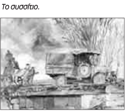
Περνώντας το Σαγγάριο.