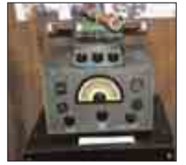
Παλιά ραδιόφωνα και εξοπλισμός.