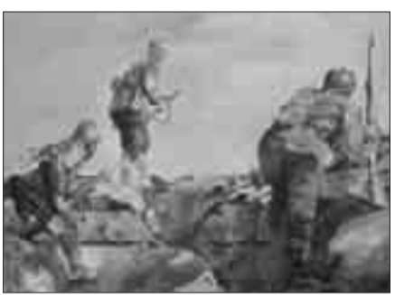
Σμύρνη, στο ύψωμα.