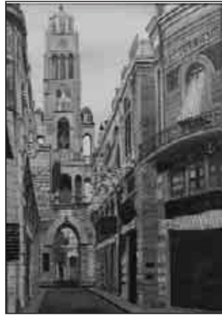
Σμύρνη. Η Αγία Φωτεινή.