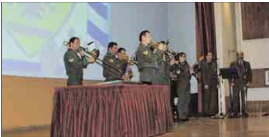
Η στρατιωτική μουσική της ΑΣΔΥΣ-ΔΥΒ.