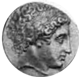
Χρυσός στατήρ Φιλίππου Β'

Αμφισβητούν ότι ο Μ. Αλέξανδρος και οι Μακεδόνες μιλούσαν Ελληνικά