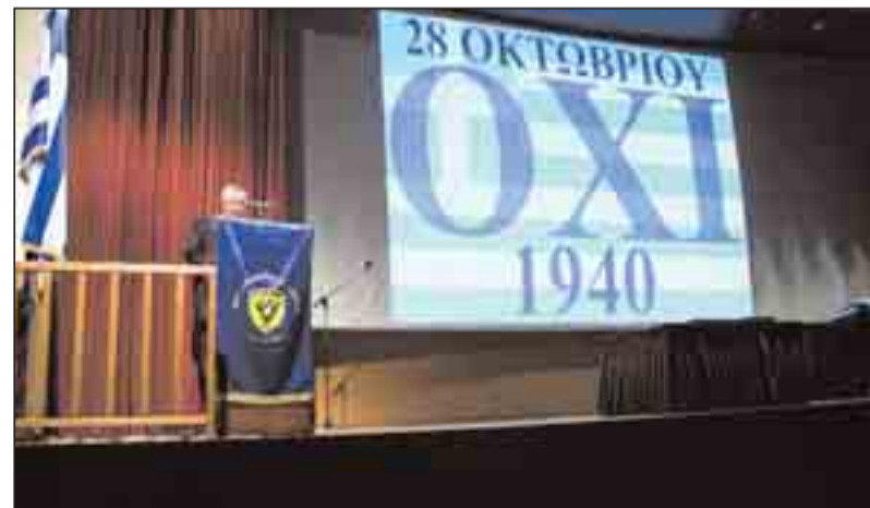
Ο ομιλητής Υποστράτηγος ε.α. κ. Μπαλιώσης.

Η εκδήλωση έκλεισε με ανάκρουση του εθνικού μας ύμνου και την καθιερωμένη δεξίωση.