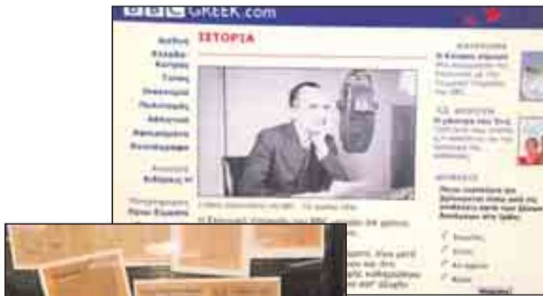
Έγγραφα που αφορούν την ιστορική διαδρομή της Ελληνικής Ραδιοφωνίας.