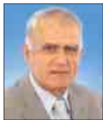
Γράφει ο ΓΕΩΡΓΙΟΣ ΚΟΡΑΚΗΣ Αντιστράτηγος ε.α. Πρόεδρος Δ.Σ. ΕΑΑΣ