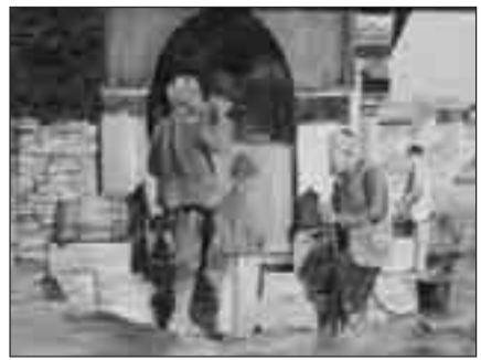
Σμύρνη. Στην Κρήνη.