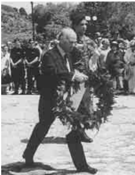
Κατάθεση στεφάνου στο Ηρώον Κέρκυρας την 21 Μαΐου, επέτειο της Ένωσης.

Την 30-5-2008 στον εορτασμό της επετείου της Ανακήρυξης της Ιταλικής Δημοκρατίας, που οργάνωσε ο εδώ Πρόξενος της Ιταλίας.