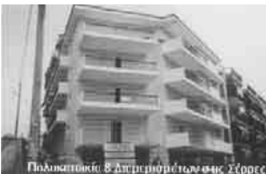
Πολυκατοικία 8 Διαμερισμάτων στις Σέρρες

Εκτιμάται ότι με την υλοποίηση των παραπάνω επιδιώξεων θα δοθεί ώθηση στα στεγαστικά προγράμματα του Οργανισμού και θα καταστεί εφικτή η εξυπηρέτηση ικανοποιητικού αριθμού μελών εντός της πενταετίας 2008 - 2012 .