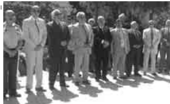
25 Μαΐου 2008. Επάνω Σκάλα Μυτιλήνης, από την εκδήλωση Ημέρας Μνήμης της Γενοκτονίας του Ελληνισμού του Πόντου.

Ο Πρόεδρος του Παραρτήματος προσκεκλημένος του Διοικητού της 98 ΑΔΤΕ