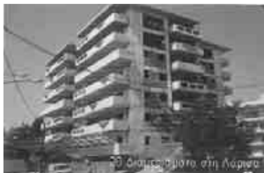
20 Διαμερίσματα στη Λάρισα