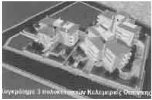
Εγκριθείσα 3 Πολυκατοικίες Καθαμαριάς Θεσσαλονίκης