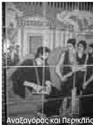
Αναξαγόρας και Περικλής

Συνήθως οι επίμορτοι καλλιεργητές ανήκουν στον χώρο εκείνο όπου η Πο-λιτεία άφθονο «έλαιον επιχέει επ' αυ-τών».