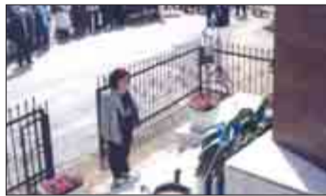
Η Αντιπρόεδρος της ΕΑΑΣ Ν. Θεσ/νίκης καταθέτει στεφάνι στο Ηρώων Σκρα.

Στην ομώνυμη κοινότητα ΣΚΡΑ του Ν. Κιλκίς εορτάσθηκε η 91η επέτειος της μάχης κατά τον Α' Παγκόσμιο Πόλεμο. Παρέστησαν οι Αρχές της περιοχής και πλήθος κόσμου από όλη την Ελλάδα καθώς και ο Δκτής Α' ΣΣ Αντγος Καττής Κων/νος.