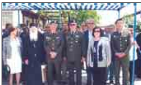
Οι παρευρεθέντες στην επιμνημόσυνη δέηση στο Σκρα.

1. Το Παράρτημα ΕΑΑΣ Νομού Θεσσαλονίκης οργάνωσε ή συμμετείχε στις παρακάτω εκδηλώσεις: