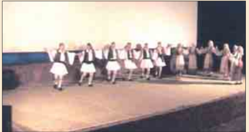
ΚΑΑΥ ΑΓ. ΑΝΔΡΕΑ 13/06/09. Χορευτικό Συγκρότημα Φιλοθέης

Το συγκρότημα απαρτίζουν ερασιτέχνες καλλιτέχνες, με μοναδικό κίνητρο την αγάπη προς την ελληνική παράδοση και, η εκτίμηση που έχουν για τα στελέχη των Ενόπλων Δυνάμεων, εκδηλώθηκε δια της συγκεκριμένης παραστάσεως.