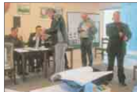
Εκλογικό Τμήμα Παραρτήματος ΡΟΔΟΥ την 26/2/2011.

Την Πέμπτη 24 Μαρτίου 2011, ο Πρόεδρος κατέθεσε στεφάνι στο Βωμό της Πα-