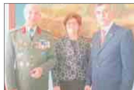
Από την τελετή παράδοσης-παραλαβής Διοίκησης 95 ΑΔΤΕ.

τρίδος, τιμώντας τους ηρωικούς αγωνιστές της Εθνικής παλιγγενεσίας της 25ης Μαρτίου ενώ την επομένη το Τ.Σ. και μέλη μας, παρακολούθησαν την Δοξολογία, την παρέλαση και τις λοιπές εορταστικές εκδηλώσεις που οργανώθηκαν από τη Νομαρχία Δωδεκανήσου.