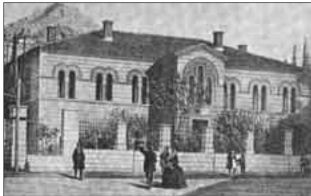
Φωτογραφία του 1860

Το κτίριο επερατώθη - ως προαναφέρθη - το 1854. Το 1868 αποφασίζεται η προσθήκη ενός ακόμη ορόφου για την αντιμετώπιση των συνεχώς αυξανόμενων αναγκών. Το έργο αυτό ανατίθεται στον τότε Ταγματάρχην Μηχανικού Γεράσιμον Μεταξάν ο οποίος και το εκτελεί με επιμέλειαν ώστε να εναρμοσθεί η προσθήκη αυτή προς την διαμόρφωση του υπάρχοντος ορόφου και όπως συνεχίζει ο Κ. Μπίρης. « Το κτίριον του οφθαλμιατρείου, με την αισθητικήν έκφρασιν του Βυζαντινού ρυθμού...αποτελεί μίαν συμπαθή αρχιτεκτονικήν σύνθεσιν, η οποία με την ιδιορρυθ-