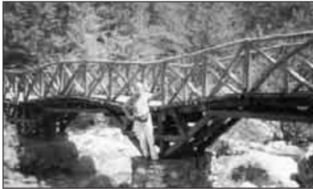
Φωτ. 2 Ένα από τα ξύλινα γεφύρια στον Ενιπέα. 5 Αυγούστου 2006.

Το άνω τμήμα του Ενιπέα από τις κορυφές μέχρι λίγο πιο πάνω από τα Πριόνια, έχει μήκος 4 χλμ. Και αποτελείται από τα πολλή ρέματα (Πετριωτικός, Παλιορουμάνο, Εθασσονίτικος, Ξεροθάκι, Διάκας, Σκαμιάς, Ζηλιάνο κ.ά.), τα οποία συγκλίνουν στην περιοχή «Πριόνια». Μέχρι την περιοχή αυτή, κυλούν υπόγεια. Οι αρχικές του πηγές είναι τρεις: Μαυρόλογγος - Καρραγιάννη και Πριονίων.