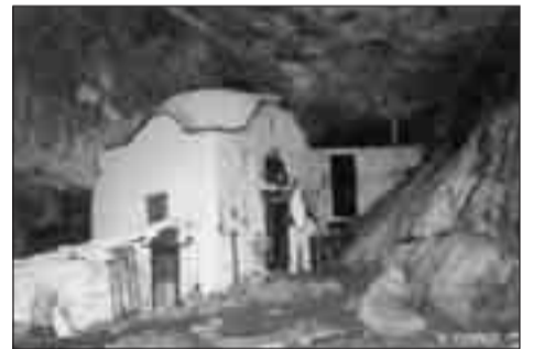
Φωτ. 3 Στο Άγιο Σπήλαιο. 5 Αυγούστου 2006.

ρος την παλαιά Μονή του Αγίου, η οποία μέχρι πριν λίγα χρόνια ήταν κατά κάποιον τρόπο εγκαταλειμμένη, μια και στον οδικό δρόμο Λιτόχωρο - Σταυρό - Πριόνια, υπάρχει η νέα «Μονή του Αγίου», η οποία και είναι ενεργός. Τελευταία έχουν αρχίσει εργασίες ανασυλλώσεως της Παλαιάς Μονής. Η διαδρομή έχει μήκος 11 χλμ. Και ο χρόνος ανάβασης, χωρίς διαλείμματα, φθάνει τις 5-6 ώρες. Στα πρώτα χιλιόμετρα (περίπου 2.500 μ.) της ανηφορικής διαδρομής και μετά πορεία 60-80 λεπτών, υπάρχει ένας βράχος, από τον οποίον είναι δυνατή η θέα τόσο προς τις κορυφές, όσο και προς το Λιτόχωρο.