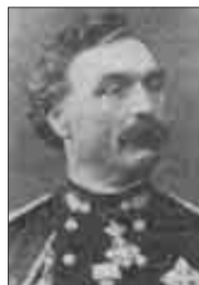
Φωτογραφία του 1860

« Ως Ανθυπολοχαγός Μηχανικού στην ανοικοδόμησιν των ανακτόρων του Όθωνος. Ανακαλύπτοντας όμως το 1842 οικονομικές ατασθαλίες στις δημοπρασίες των υλικών, τις οποίες του ζη-