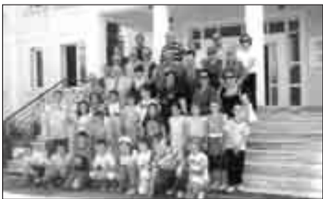
Προσκυνηματική επίσκεψη του Παρ/τος στην Κορυτσα, με επικεφαλής τα μέλη του Δ.Σ.