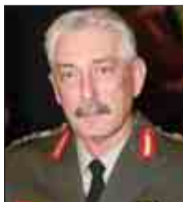
τ. Α/ΓΕΕΘΑ Στρατηγός Δημήτριος Γράψας