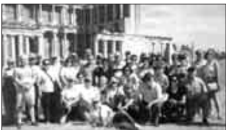
Από την επίσκεψη στους αρχαιολογικούς χώρους των παραλίων της Μ. Ασίας των εκδρομών του Παρ/τος.

Το Παράρτημα της Ενώσεως Αποστράτων Αξκών Ν. Θεσσαλονίκης, συνεχίζει τις συχνές Δραστηριότητες και Εκδηλώσεις όπως παρακάτω: