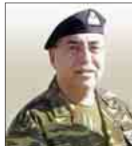
τ. Α/ΓΕΣ Αντιστράτηγος Δημήτριος Βούλγαρης