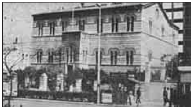
Φωτογραφία του 1984

μίαν της, δημιουργεί, παραπλεύρως της αρχιτεκτονικής τριηλογίας Βιβλιοθήκης, Πανεπιστημίου και Ακαδημίας, του νεοκλασσικού Ελληνικού ρυθμού και κάποιαν φυγήν αισθητικής αλληλεγγύης». (1)