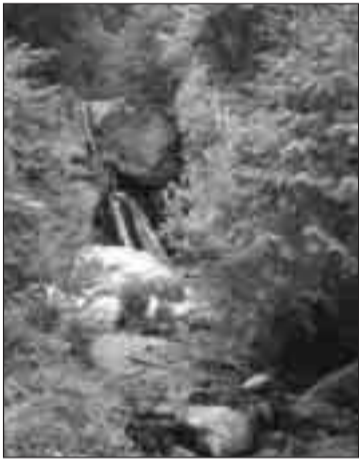
Φωτ. 1 Η πηγή - καταρράκτης στη θέση Πριόνια, (18 Ιουνίου 2005)

Είναι το μοναδικό ποτάμι του Ολύμπου. Πηγάζει κάτω από το οροπέδιο των κορυφών και καταλήγει μέσω τεχνητών καναλιών, στη θαλάσσια περιοχή κοντά στη Σκάλα του Λιτόχωρου. Έχει μήκος 20 χλμ. Μέχρι το 1950 κατέληγε στο έλος του Βαρικού, το οποίο σήμερα έχει αποξηρανθεί.