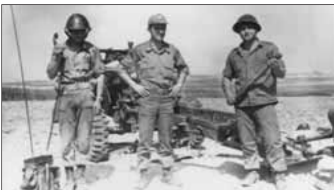
Από άσκηση της Γ' Πυροβολαρχίας στην περιοχή Νήσου Οκτωβρίου 1974

δενικές - στην κυριολεξία- απώλειες. Και όλα αυτά κάτω από το συνεχές σφυροκόπημα της Τουρκικής αεροπορίας, χωρίς την κάλυψη τμημάτων ελιγμού. Ακόμα και με το πέρας των εχθροπραξιών, παρέμεινε ταγμένη, σε πλήρη πολεμική ετοιμότητα για 10 περίπου μήνες. Ας δούμε εν συντομία τη δράση της.