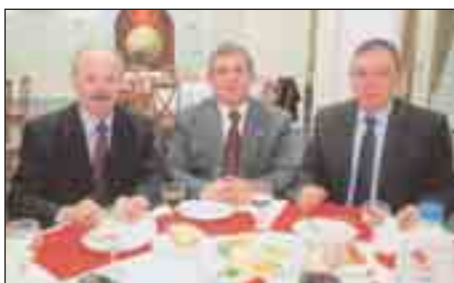
Αποχαιρετιστήριο δείπνο με τον Στρατηγό Δκτή Α' ΣΣ την 14 Μαρτίου 2011.

1. Την 16 Ιαν. 2011, ο Πρόεδρος και ορισμένα μέλη του Παραρτήματος Ν. Κοζάνης επισκέφθηκαν το Ε.Φ. ΜΟΛΥΒΔΟΣΚΕΠΑΣΤΟ, στην περιοχή Κόνιτσας Ιωαννίνων, αφού προηγουμένως προηγήθηκε στάση στην ομώνυμη μονή για τον καθιερωμένο εκκλησιασμό, συνάντηση και συνομιλία με τον ηγούμενο της μονής και προσφορά καφέ. Κατά την επίσκεψή μας εν συνεχεία στο φυλάκιο, ο Δκτής, τα στελέχη και οι οπλίτες της Μονάδας Προκάλυψης (583 ΤΠ), μας επιφύλαξαν θερμότατη υποδοχή, ακολούθησε λεπτομερής ενημέρωση, προσφέρθηκε σχετικό κέρασμα και η όλη εικόνα που παρουσιάστηκε ήταν αρκετά εγκάρδια, φιλόξενη και ευχάριστη. Από μέρους του Παραρτήματος προσφέρθηκε ένα πλυντήριο ρούχων για την κάλυψη των καθημερινών αναγκών του φυλακίου. Στη συνέχεια επισκεφθήκαμε την πόλη των Ιωαννίνων, όπου τα μέλη μας παρακάθησαν σε γεύμα στη ΛΑΦΙ και ακολούθησε περιήγηση και ξενάγηση στα αξιοθέατα και στη ήμνη της πόλης.