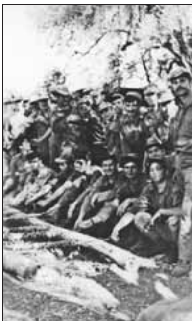
Η Γ' Πυροβολαρχίας από εορτασμό του Πάσχα τον Απρίλιο 1975.

Την 24 Ιουλίου και ενώ ευρίσκετο ακόμη στο χωριό ΣΤΥΛΛΟΙ πληροφορήθηκε την μεγάλη καταστροφή που υπέστη η Μοίρα. Η πρώτη και άμεση ενέργεια του Διοικητού Πυροβολαρχίας ήταν να εξυψώσει το ηθικό των στρατιωτών του και να διατηρήσει την μαχητική ικανότητά τους σε υψη-