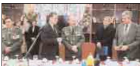
Τελετή παράδοσης-παραλαβής Δκσεως Α' ΣΣ την 17 Μαρτίου 2011.

Τέλος ο Πρόεδρος και μέλη του Παραρτήματος, μετείχαν στις εορταστικές εκδηλώσεις εορτασμού της εθνικής επετείου.