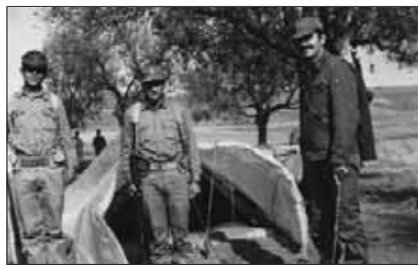
Επιθεώρηση Γ' Πυροβολαρχίας από τον Διοικητή στην περιοχή Νήσου Νοέμβριος 1974.

Τι απέγινε όμως η τρίτη πυροβολαρχία της Μοίρας, η Γ', κινήθηκε ανεξάρτητα από τις υπόλοιπες;