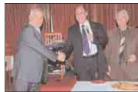
Από την εορτή κοπής πίτας την 4/3/2011 του Παρ/τος.

Επίσης συμμετείχε στον εορτασμό της Εθνικής επετείου της 25ης Μαρτίου 1821. Θεία Λειτουργία, Δοξολογία, ομιλία από τον Εκπαιδευτικό του 5ου Δημοτικού Σχολείου Κορίνθου κ. Γεραρή Ηλία και στην ημερίδα του