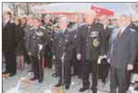
Εορτασμός εθνικής επετείου 25ης Μαρτίου 2011

σαν στην τελετή κοπής της πίτας του Συνδέσμου Εφέδρων Αξιωματικών Κοζάνης, που πραγματοποιήθηκε στην ΛΑΦ Κοζάνης και στην ετήσια επίσημη χοροεσπερίδα και στην κοπή της πρωτοχρονιάτικης πίτας του Παραρτήματός μας, που πραγματοποιήθηκε στην Λέσχη Αξιωματικών Φρουράς Κοζάνης, χωρίς την παρουσία αρχών της πόλεως και επισήμων, η οποία και σημείωσε πράγματι, μεγάλη επιτυχία.