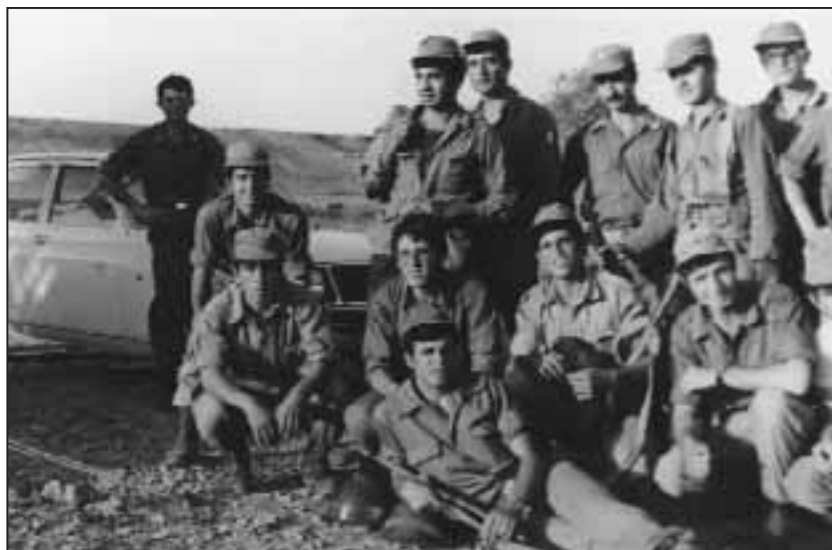
Ο Διοικητής της Γ' Πυροβολαρχίας με οπλίτες της Πυροβολαρχίας στην περιοχή Νήσου.

Τη Νύκτα 19/20 Αυγ 1974 μετακινήθηκε στην περιοχή μεταξύ του χωριού ΝΗΣΟΥ και του χωριού ΔΑΛΙ υποστηρίζοντας την ενέργεια για την περίσφιξη και εξάλειψη του Τ/Κ θύλακα της ΛΟΥΡΟΥΤΖΙΝΑΣ. Στη θέση αυτή παρέμεινε και μετά το πέρας των εχθροπραξιών, σε πλήρη πολεμική ετοιμότητα, μέχρι τον Αύγουστο του 1975, οπότε και ενσωματώθηκε στην 182 ΜΠΠ, στην περιοχή του Αγίου Ιωάννη Μαθιούνας, για να συμπληρώσει την αποθεσθεία από τις επιχειρήσεις Πυροβολαρχίας της παραπάνω Μοίρας. Έτσι έκλεισε η λαμπρή ιστορία της 181 ΜΠΠ με μεγάλη προσφορά και θυσίες σε αυτόν τον αγώνα.