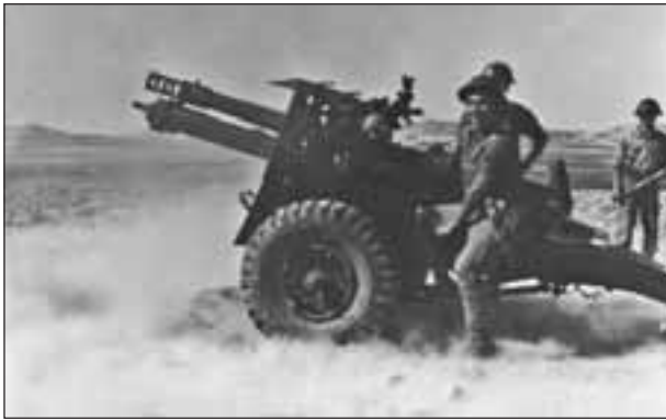
Η Γ' Πυροβολαρχίας σε δράσει.