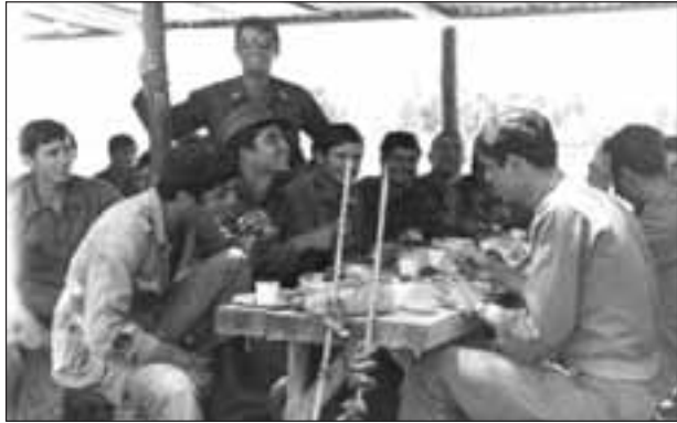
Από τον εορτασμό του Πάσχα 1975 της Γ' Πυροβολαρχίας στην Περιοχή Νήσου.