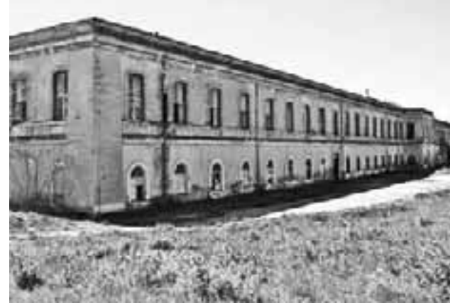
Στρατόπεδο Παύλου Μελά

Η ΕΑΑΣ θα προκηρύξει διαγωνισμό Φωτογραφίας, με θέμα: «Παλιά στρατόπεδα», θέλοντας να διασώσει ό,τι μπορεί από τις κυψέλες αυτές που φιλοξένησαν χιλιάδες άνδρες μόνιμους ή έφεδρους, που συγκροτούν σχεδόν το ήμισυ της ελληνικής κοινωνίας.