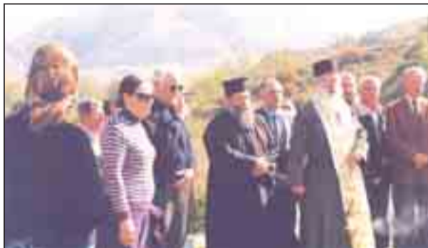
Επιμνημόσυνος δέηση στον Τάφο του Έλληνα Στρατιώτη στη Μπομποσίτσα