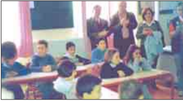
Επίσκεψη Ελληνοαλβανικού Σχολείου «ΟΜΗΡΟΣ» στην Κορυτσά