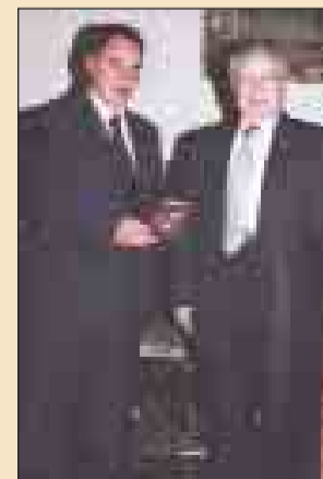
Απονεμές πλακετών π. Πρωθυπουργόν, Πρόεδρο ΕΑΑΣ, Ρώσους Ακολούθους