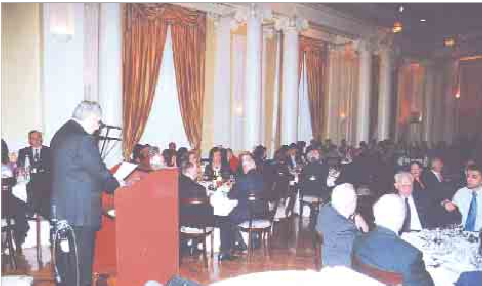
Γενική άποψη της αίθουσας τελετών της ΛΑΕΔ κατά την εκδήλωση