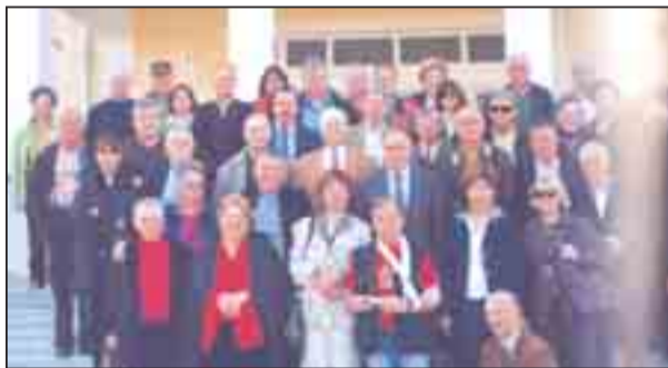
Οι εκδρομείς προσκυνητές μπροστά στο Ελληνοαλβανικό Σχολείο Κορυτσας