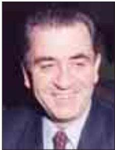
Γράφει ο ΠΕΡΙΚΛΗΣ ΚΟΡΜΑΣ Διευθύνων Σύμβουλος ΕΑΑΣ