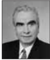
Γράφει ο ΙΩΑΝΝΗΣ ΑΣΛΑΝΙΔΗΣ Αντιστράτηγος ε.α.

Δεν ξέρω ποιο εθνικό ή πατριωτικό αποτέλεσμα έφερε ο αγώνας και οι προσπάθειες των αγανακτισμένων ανθρώπων της πλειατείας Συντάγματος. Πιστεύω ότι έγινε αποδεκτός με ενθουσιασμό και ανακούφιση αρχικά από τους σκεπτόμενους Έλληνες, μέχρις ότου παρεισέφερσαν μέσα στις τάξεις των, κομματικά στοιχεία, αναρχικοί και κοινωνικές ομάδες που σχεδόν δια της βίας υπερασπίζονται τις συντηρητικές των απαιτήσεις. Από την στιγμή εκείνη και επέκεινα, δέος, τραγική εικόνα, θλίψη, κατήφεια και ντροπή. Αποτέλεσμα η τραγική συνήθης εικόνα όπως πάντα και οι τραγικές περαιτέρω συνέπειες για την χώρα μας.